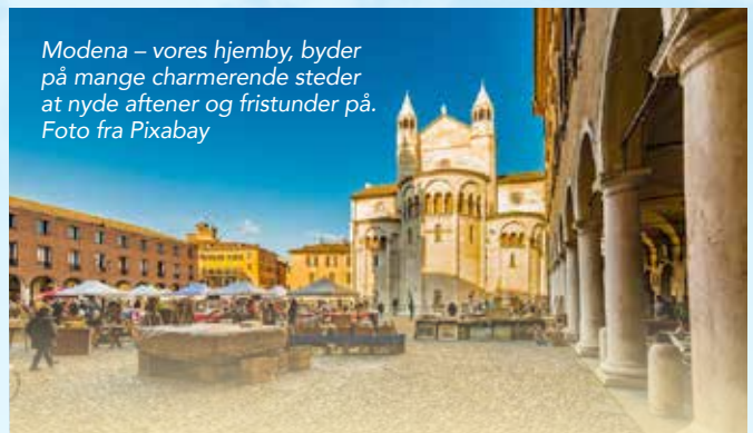
Modena – vores hjemby, byder på mange charmerende steder at nyde aftener og fristunder på.